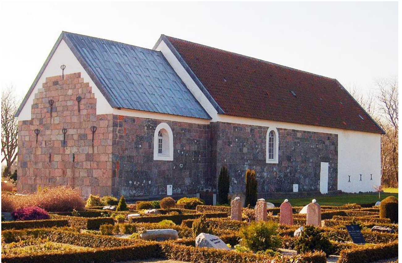
Jelstrup kirke (Vennebjerg herred, Vendsyssel)