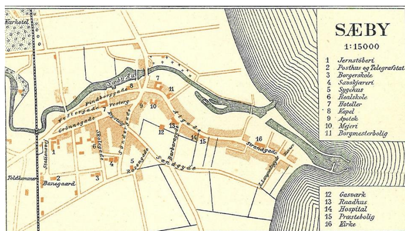
Kort over Sæby omkring år 1900. Her er Krystalgade angivet.