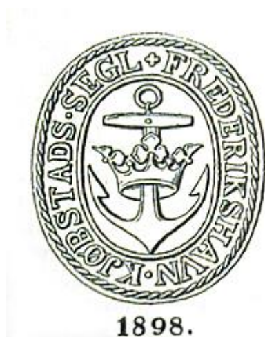
Frederikshavn Købstads Segl fra 1898