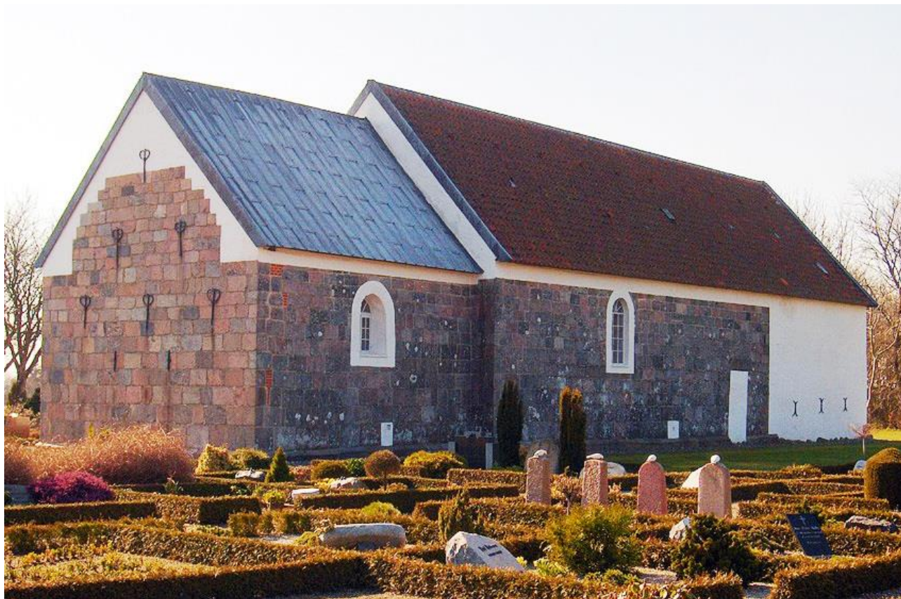
Jelstrup kirke (Vennebjerg herred, Vendsyssel)