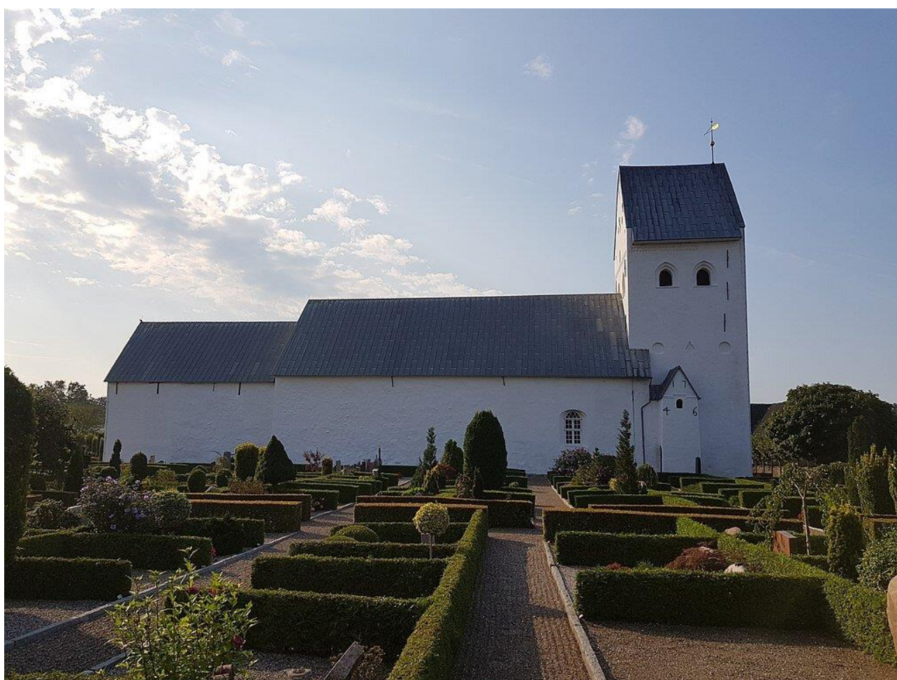
Ravsted kirke, bygget ca. 1100