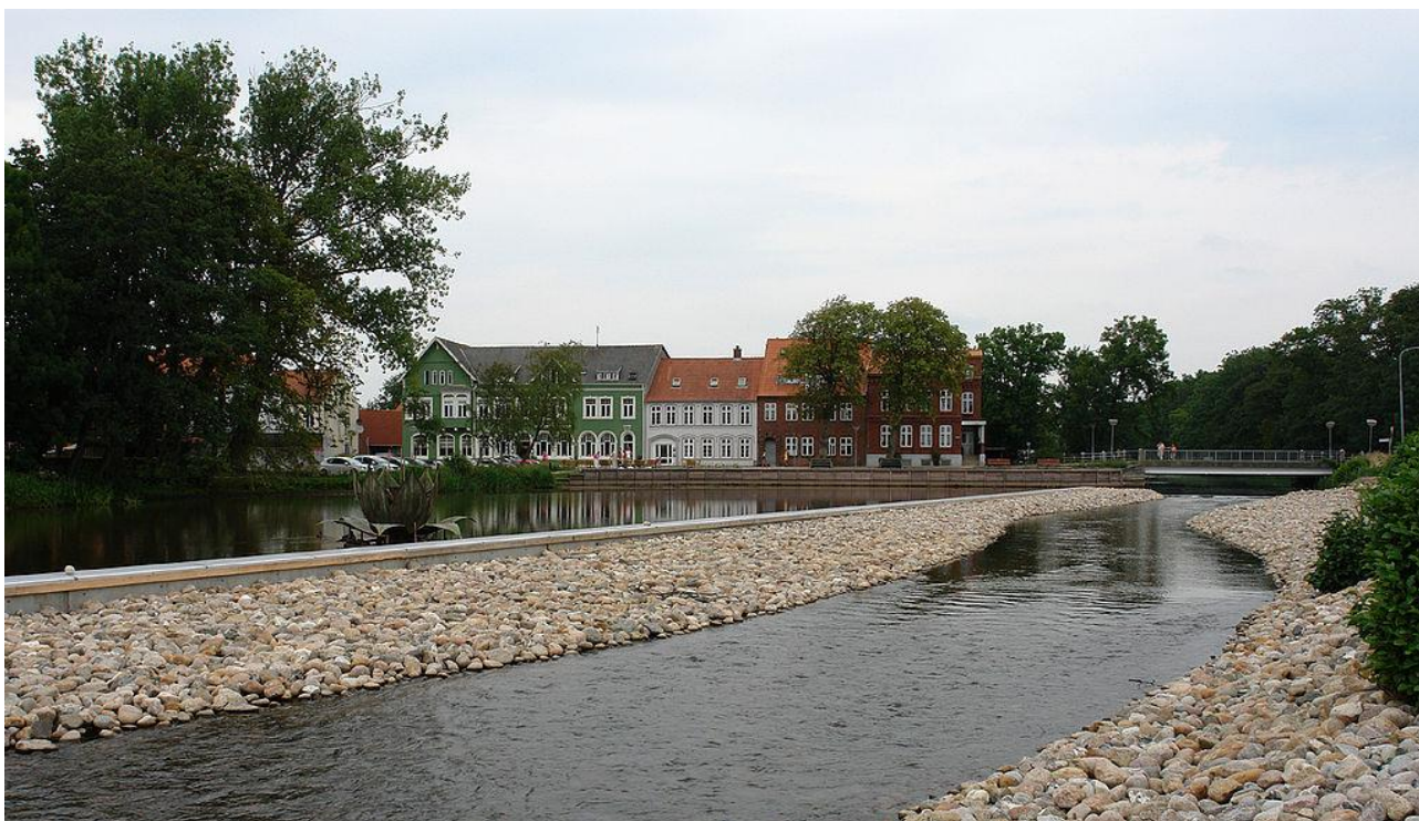
Vidå gennem Tønder. Udsigt fra Kongevej mod nordøst