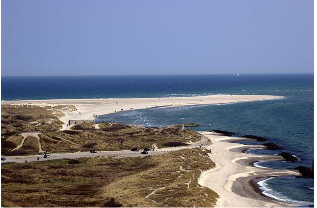
Grenen: Nordspidsen af Vendsyssel (og Danmark)

Billede: Martin Olsson (mnemo on en/sv wikipedia and commons, martin@minimum.se)., Skagen aka the skaw northmost point of denmark 6th may 2006 , CC BY-SA 3.0