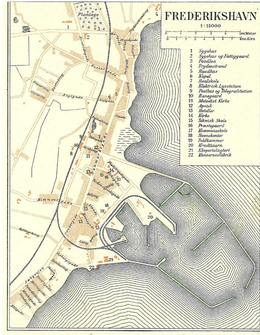
Frederikshavn o. 1900

Fotolitograferede i Generalstabens Topografiske Afdeling, Frederikshavn o1900 , als gemeinfrei gekennzeichnet, Details auf Wikimedia Commons