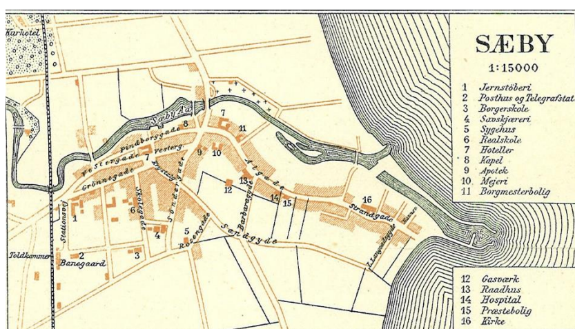
Kort over Sæby omkring år 1900. Her er Krystalgade angivet.