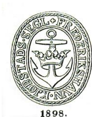
Frederikshavn Købstads Segl fra 1898